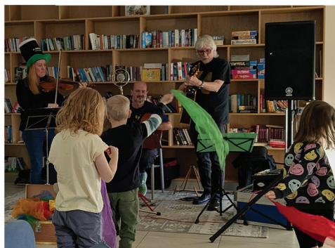
kokon - Reha für junge Menschen