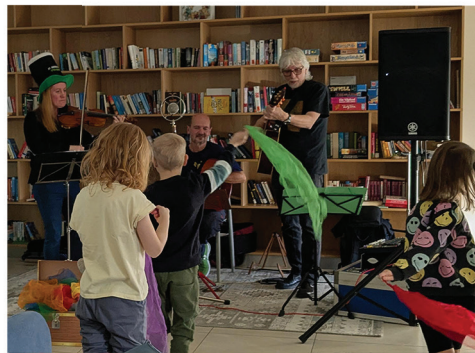
kokon - Reha für junge Menschen